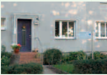
Büro in Kirchmöser

Seit 01. Juli 2005 befindet sich das Maklerbüro „ALLSOLID“, das eine 15-jährige erfolgreiche Tätigkeit vorweisen kann, in Kirchmöser West. Unser Maklerbüro ist ein Dienstleister, der ähnlich wie ein Steuerberater oder Rechtsanwalt arbeitet, aber ohne Honorare dafür zu erheben.