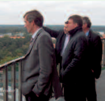
Blick vom Wasserturm