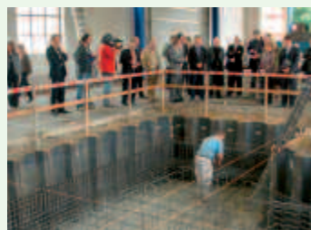
Die derzeitige Halle wird ausgebaut

Ursache für die erfolgreiche Entwicklung des Unternehmens ist die zunehmende Bedeutung der Windenergie beim Ausbau des Anteils der erneuerbaren Energien und der damit verbundene Aufschwung im Bereich Windkraftanlagenindustrie.